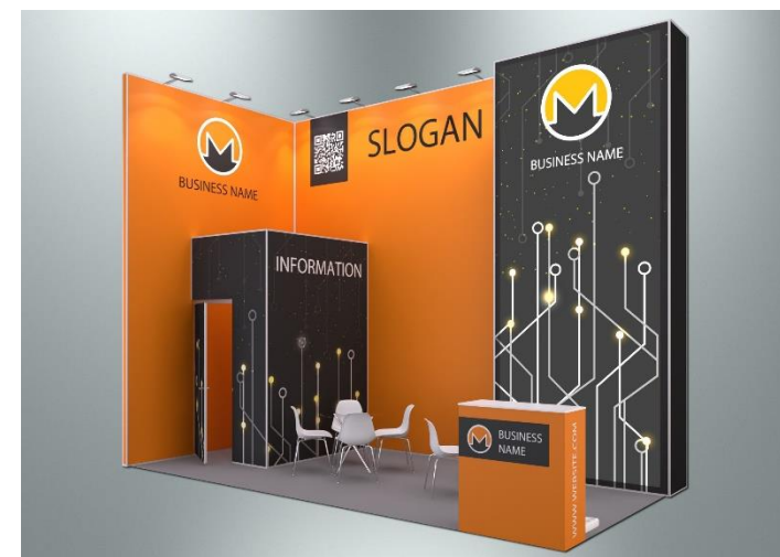
Пример оформления стенда с полноцветным оформлением поверхностей (дополнительная услуга)