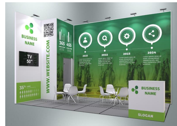
Пример оформления стенда с полноцветным оформлением поверхностей (дополнительная услуга)