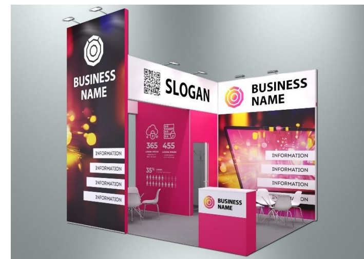
Пример оформления стенда с полноцветным оформлением поверхностей (дополнительная услуга)