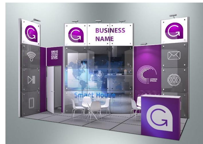
Пример оформления стенда с полноцветным оформлением поверхностей (дополнительная услуга)